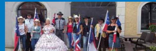
Country- & Westernklub